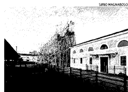
Al Macro Testaccio. Big Bambù dei fratelli americano Starn per Enel Contemporanea 2012

L'opera si sviluppa fino a circa 25 metri di altezza grazie all'utilizzo del bambù. Costruito manualmente dagli artisti e dal loro gruppo di arrampicatori, l'imprevedibile incrociarsi dei bambù diventa elemento giocoso ed espressione della molteplicità della vita e della creatività umana.